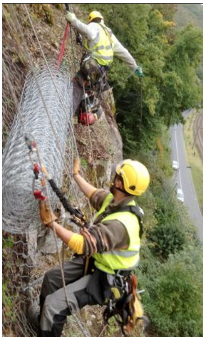
Après avoir défriché la falaise, ôter les pierres dangereuses, les cordistes s'attellent à forer puis poser un grillage au-dessus d'une route et d'une voie ferrée en Belgique.

Sur certains chantiers, les baudriers et cordes sont mis à rude épreuve. Il faut alors les changer souvent pour notre pro-