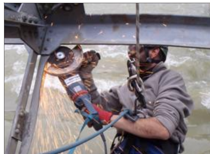
Chantier sur un barrage hydraulique, suspendu au-dessus des chutes d'eau.