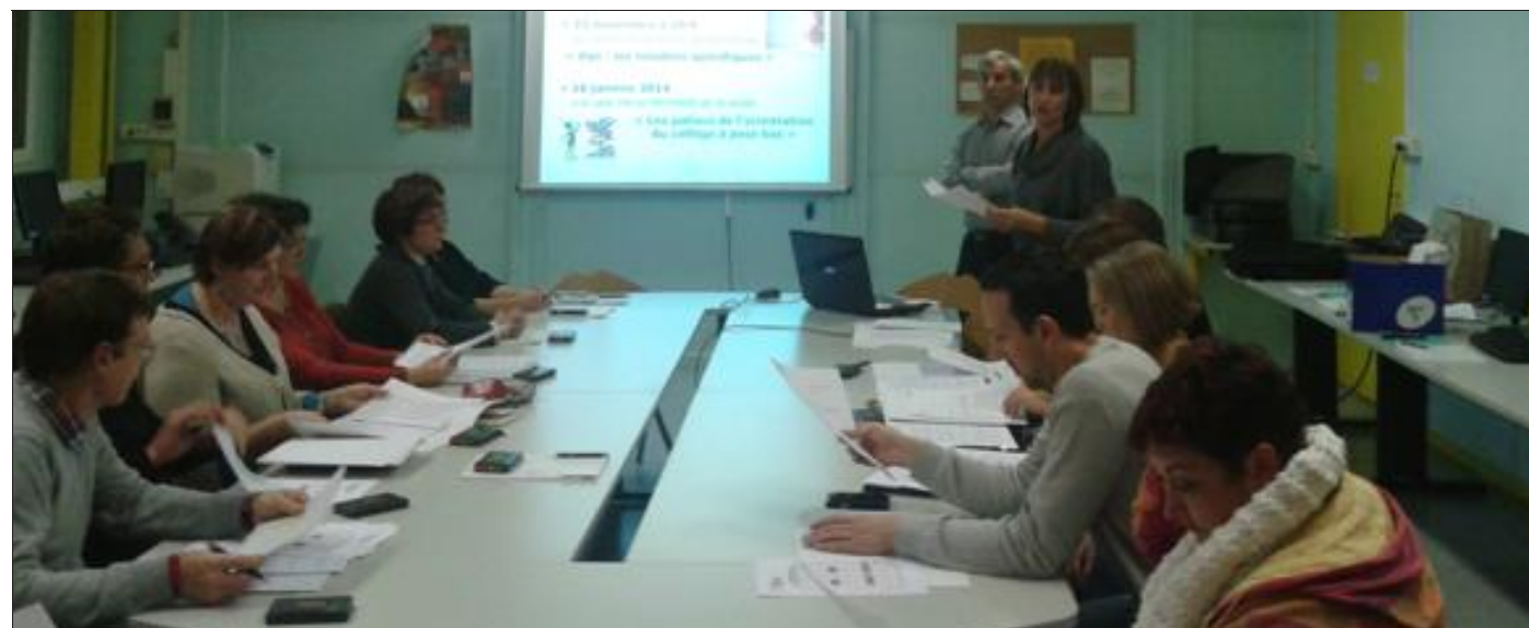
La formation est appréciée par les parents délégués.

Les membres du comité local, ainsi que les représentants FCPE des différents établissements, tous bénévoles, sont à l'écoute de tous les parents et joignables par téléphone, courriel ou par notre site internet : www.fcpe-saint-avold.com.