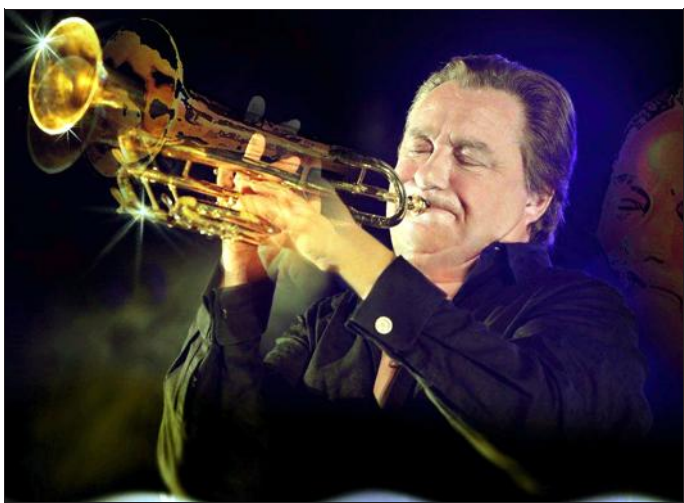
Jean-Claude Borelly sera en concert à l'abbatiale Saint-Nabor le samedi 15 novembre.

Le célèbre trompettiste, Jean-Claude Borelly, présentera son nouveau concert au profit du Comité Unicef de la Moselle, samedi 15 novembre à 20 h 45 à l'abbatiale de Saint-Avold. Jean-Claude Borelly et son accompagnateur (clavier-chanteur) interpréteront des airs classiques, du gospel, mais aussi du jazz, l'Ave Maria de Gounod, des extraits de l'Adagio d'Albinoni, du Concerto de la Mer, l'incantatoire Il Silenzio, des musiques de films, des compositions de Pierre Bachelet, Barbara Streisand, Edith Piaf, sans oublier Dolanès Mélodie. Ce programme, intitulé "D'or de rêve et de lumière" est un véritable spectacle où la mise en lumière, sobre et artistique, accompagne à la perfection le jeu instrumental de l'artiste au gré de ses mouvements et de ses déplacements qui n'ont de cesse de faire vibrer la sensibilité de l'assistance, grâce aux sonorités inégales de sa trompette et au rayonnement spirituel des lieux où il se produit.