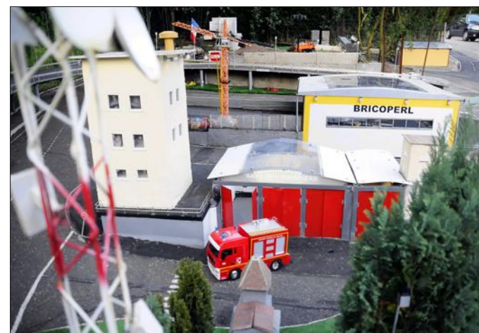
C'est toute une ville qui est sortie de terre ces deux dernières années.