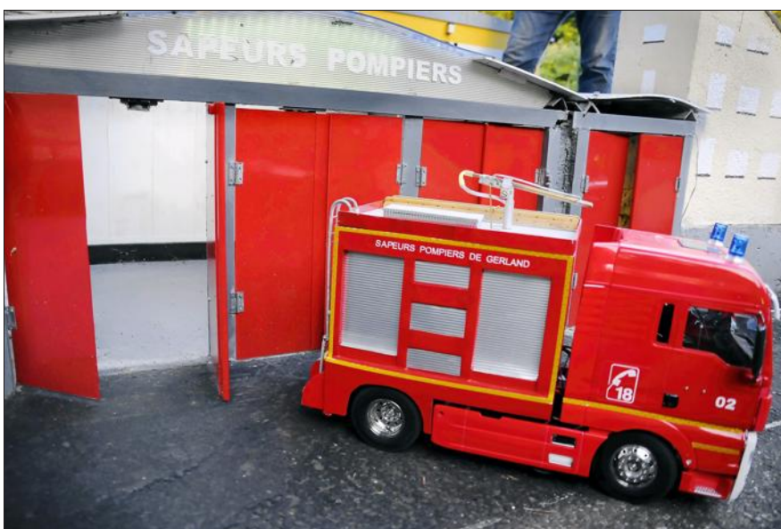
Le camion de sapeurs-pompiers de Gerland est capable d'éteindre un incendie.