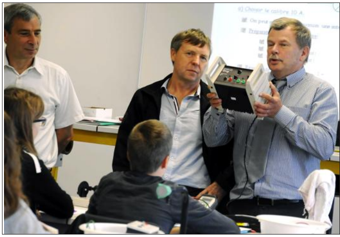
Les six nouveaux générateurs ont coûté 200 euros chacun.

Le collège La Fontaine a reçu jeudi six nouveaux générateurs électriques, financés par la FCPE, pour les cours de physique.